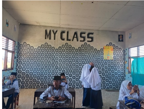
صورة ٢. الامتحان

الهواتف المحمولة إلى الفصل. قبل بدء اللعبة، يتم شرح المواد التي تعتبر أساسًا للطلاب للإجابة على الأسئلة الموجودة في تطبيق Wordwall، وذلك كإعداد يساعد الطلاب على تذكر المواد التي تم تقديمها بالفعل.