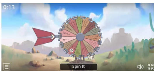
صورة ٤. السؤال

في تطبيق وسائط Wordwall هذا، استخدم الباحثون قالب الدوران (العجلة) كلعبة في تقييم تعلم اللغة العربية لطلاب الصف السابع بمدرسة نحضة وطن الدينية المدرسة الإسلامية الثانوية الإسلامية تباان. لتصفح Wordwall هذا، قام الباحثون بمشاركة رابط الأسئلة بصورة دوران عبر مجموعة WhatsApp للصف السابع بمدرسة نحضة وطن الدينية المدرسة الإسلامية الثانوية الإسلامية تباان. بعد ذلك، يمكن للطلاب البدء في الإجابة على الأسئلة الموجودة في لعبة الدوران.